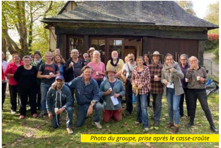
Photo du groupe, prise après le casse-croûte

vous ! Vos suggestions sont les bienvenues et encore mieux si vous voulez devenir adhérents. N'hésitez pas à nous contacter, vous serez accueilli(e)s avec joie.